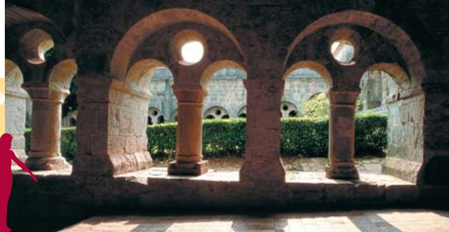
Os arcos de volta inteira marcam o ritmo das galerias do claustro