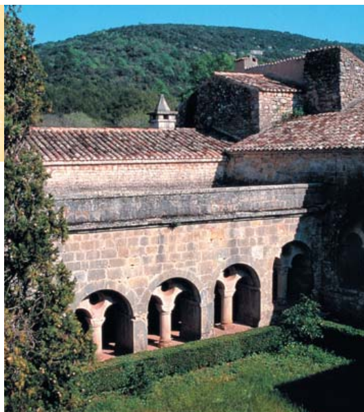
O interior do claustro visto de cima