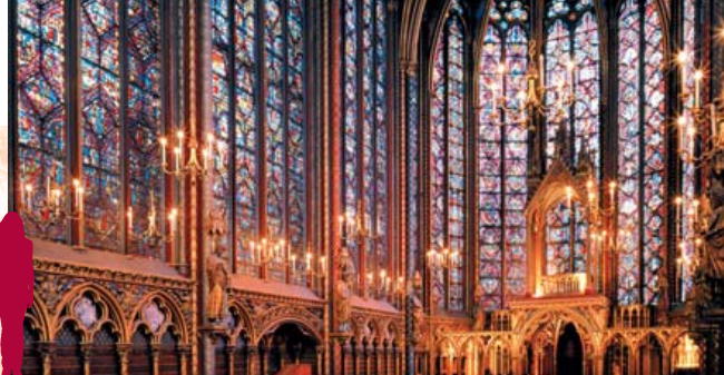
A alta capela