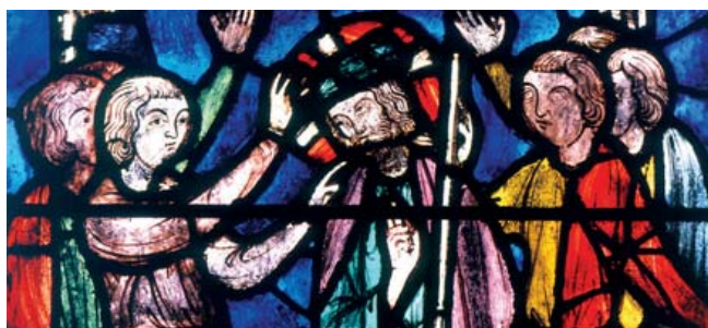
"A Paixão de Cristo" - A coroação com Espinhos

até às 22h das Quartas-feiras de Maio a Setembro (informe-se)