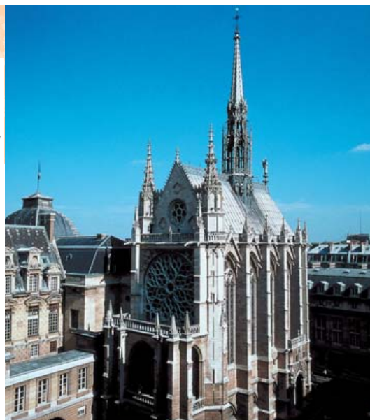
A Santa Capela