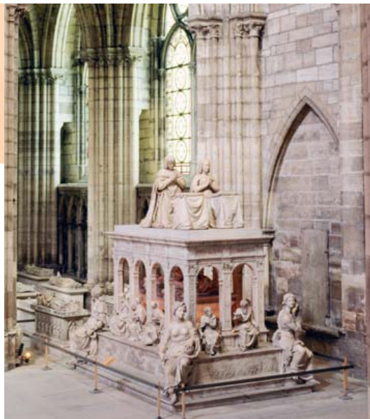
Basilica catedral de Saint-Denis