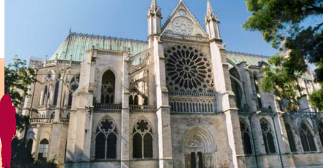
Basilica catedral de Saint-Denis