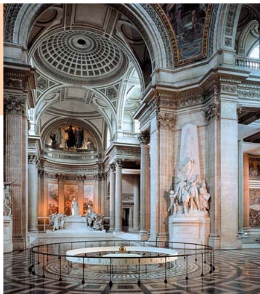
O Panteão - O pêndulo de Foucault