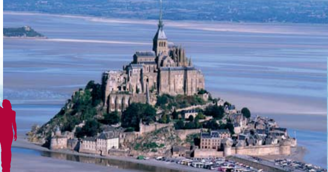
Vista aérea do Mont-Saint-Michel