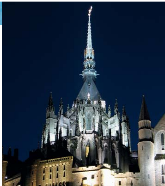
A abadia do Mont-Saint-Michel à noite

> Pavilhão de informação sobre o Restabelecimento do carácter marítimo do Monte Saint-Michel - www.projetmontsaintmichel.fr