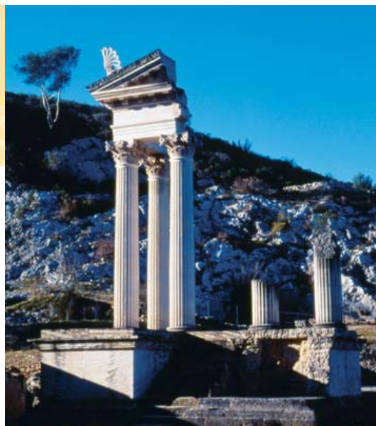
O pequeno templo geminado - Reconstituição parcial