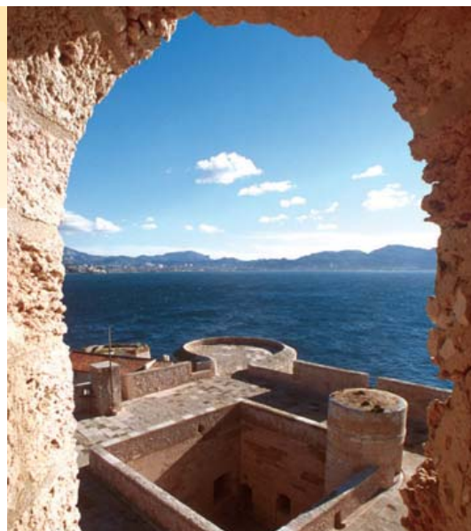
Vista da baía de Marselha, tirada do torreão do castelo