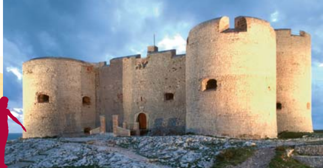
A fachada do castelo de If