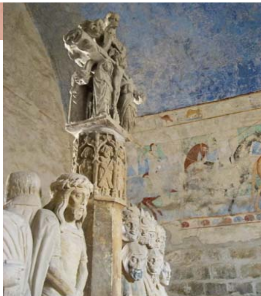
Escultura do museu Lapidar