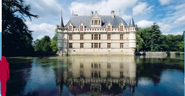
Castelo de Azay-le-Rideau