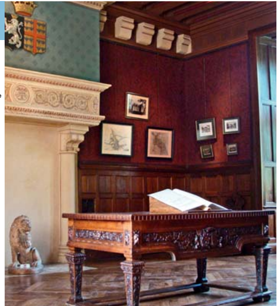
Castelo de Azay-le-Rideau